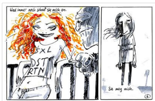
aus: "Der kleine Comic-Killer und die Frauen"

Stephan: Was treibt einen jungen Menschen dazu, sich komplett gegen alle anderen zu stellen, sie umzubringen, um sich zu schießen? Wie gehen seine Mitmenschen mit ihm oder ihr um, vor allem vorher? Um es nicht missverständlich zu sagen: eine solche Tat selbst ist nicht zu rechtfertigen. Aber irgendwas passiert doch vorher? Was könnte das sein, wie könnte das ablaufen? Das wollte und kann ich nicht beantworten, aber zumindest wollte ich die Frage stellen und eine Möglichkeit zeigen. Die Figur des Comic Killers eignet sich dafür, denke ich: mit einer extrem verzerrten und ich-bezogenen Wahrnehmung, es ist kaum noch zu erkennen, was er sich einbildet von dem, was tatsächlich passiert. Und: er ist klar als Psycho gezeichnet.